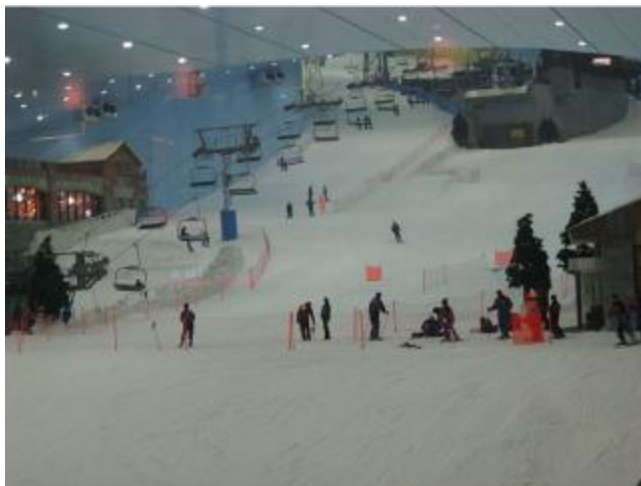
Obr. č. 15 – Indoorový lyžiarsky areál Ski Dubai

Najvýznamnejšou budovou v meste je Veľká mešita, ktorej kapacita je vyše 40000 ľudí. Neďaleko mesta leží pretekársky okruh F1 Yas Marina Circuit.