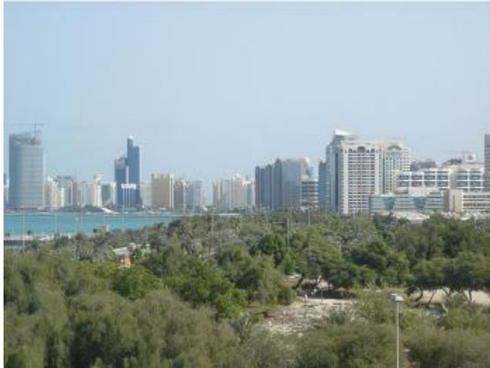
Obr. č. 2 – Mesto Abú Zabí s množstvom kontrastov.

( http://upload.wikimedia.org/wikipedia/commons/thumb/8/83/AbuDhabi02.JPG/800px-AbuDhabi02.JPG )