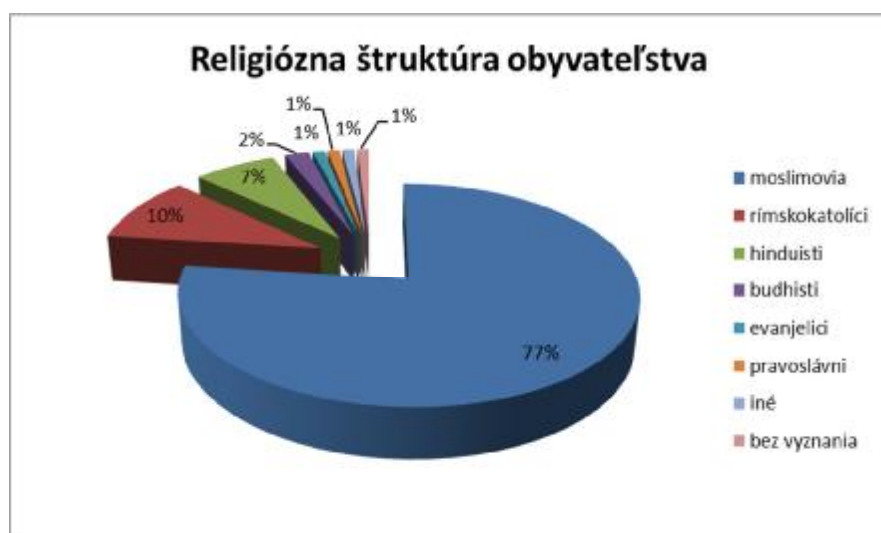
Graf č. 3 – Religiózne zloženie obyvateľstva SAE(rok 2013)

http://en.wikipedia.org/wiki/United_Arab_Emirates